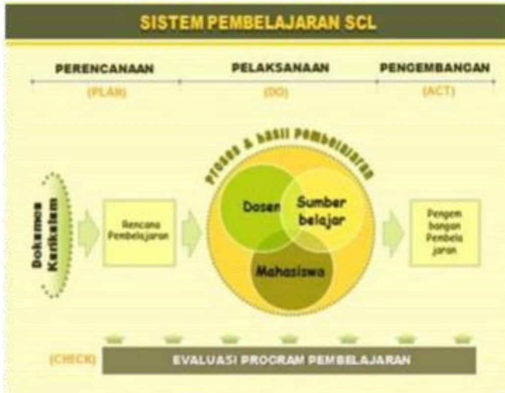
Gambar 12. Sistem Pembelajaran Berbasis SCL