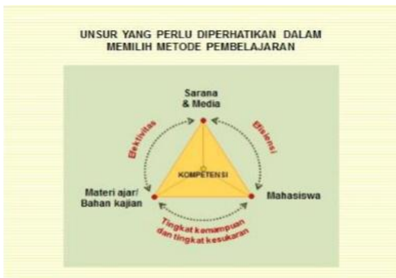
Gambar 14. Unsur Pemilihan Metode Pembelajaran

Model Jurisprudensi/Debat sangat cocok digunakan untuk meningkatkan keterampilan berkomunikasi secara lisan (communication skill) para mahasiswa. Melalui model ini mereka akan terlatih menyusun kalimat dan menyampaikannya dengan tutur kata yang jelas dan teratur sehingga mudah dipahami. Di samping itu, Model Jurisprudensi juga dapat digunakan untuk melatih mahasiswa dalam menyampaikan pikiran yang didasarkan argumentasi ilmiah. Salah satu syarat bagi dosen dalam menerapkan model pembelajaran jurisprudensial ialah bahwa materi atau topik yang dibahas harus bersifat “debatable” (dapat diperdebatkan).