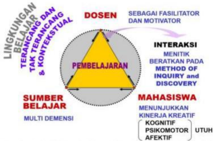
Gambar 13. Student Centered Learning