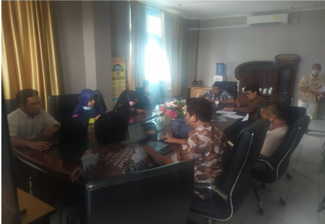
Lampiran 1. Foto